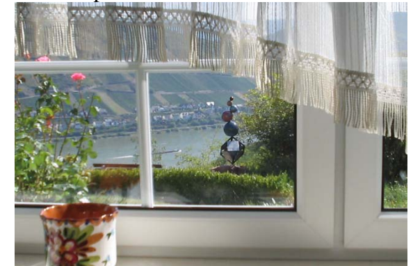
Vue sur le Rhin de la chambre de séjour

Vacances pour 2 à 4 personnes près de Bacharach sur les collines de la fascinante région de la vallée moyenne du Rhin, inscrit dans la liste du patrimoine culturel mondial de l'UNESCO : Appartement à 2 chambres avec cuisine et bain, entrée séparée et une vue directe sur le Rhin.