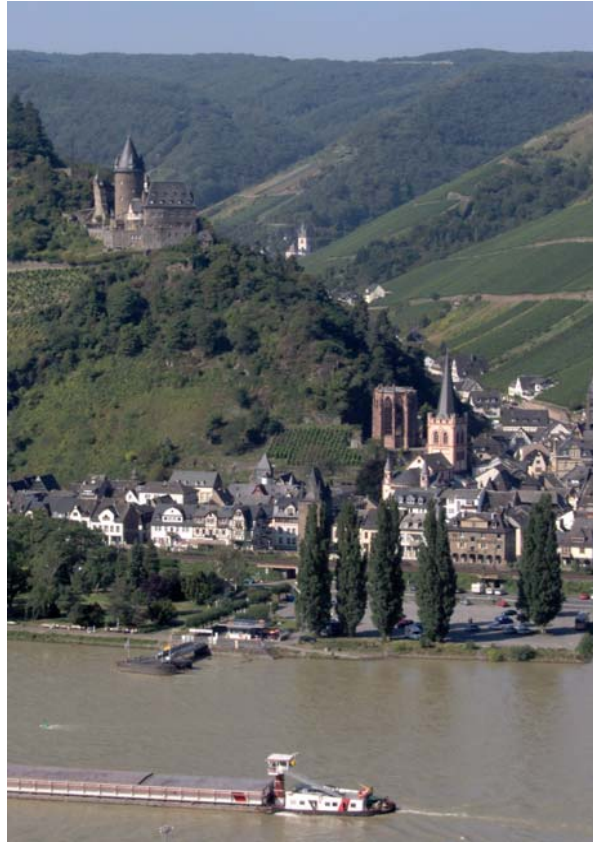
Vue de Bacharach de l'autre rivage du Rhin