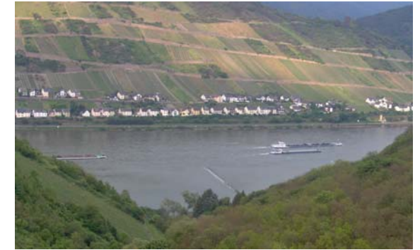
Perspective de terrasse

Vacances pour 2 à 4 personnes près de Bacharach sur les collines de la fascinante région de la vallée moyenne du Rhin, inscrit dans la liste du patrimoine culturel mondial de l'UNESCO : Appartement à 2 chambres avec cuisine et bain, entrée séparée et une vue directe sur le Rhin.