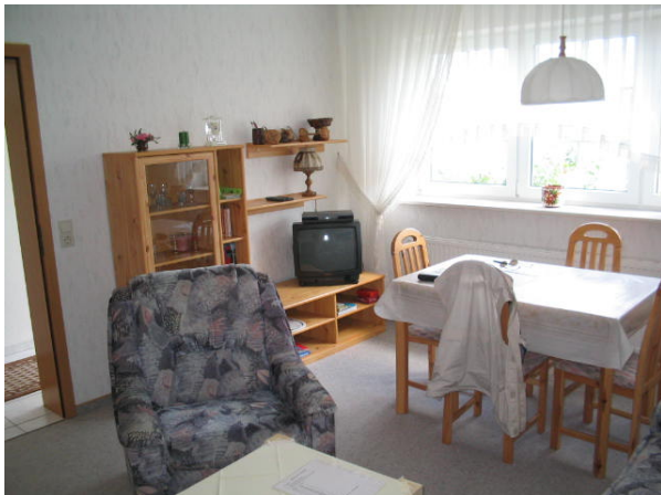
Vue partielle de la salle de séjour

Les ligne de lit, des serviettes et frais accessoires sont incluses, le téléphone et l'Internet sont chargés séparément.